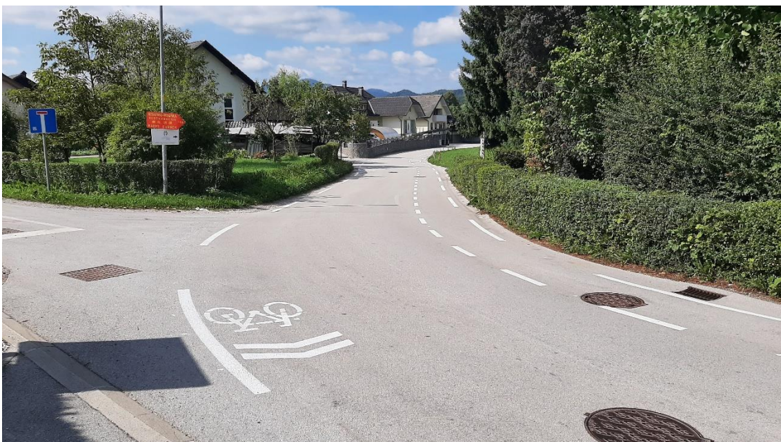
Novo kolesarske površine v Bitnjah – desno kolesarski pas na vozišču, levo ureditev na način souporabe (»sharrow«)