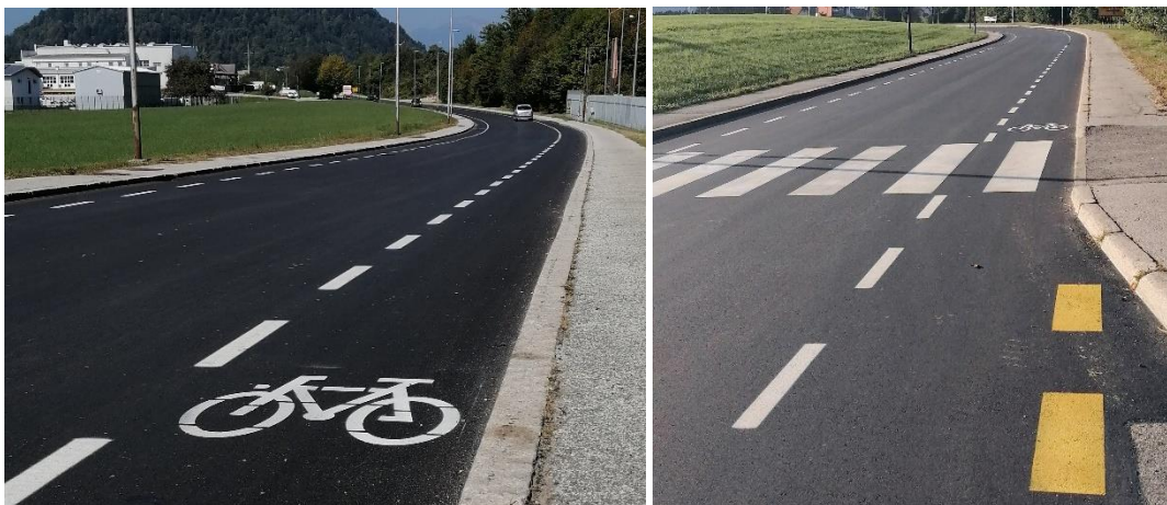
Obnovljeni odsek Poti za krajem.

Odsek Poti za krajem, od križišča na Laborah do nadvoza čez Delavski most, v dolžini 600 metrov, ima zdaj novo asfaltno prevleko, obnovili pa so tudi talne oznake (prehodi za pešce, avtobusna postaja, kolesarski pas) in zamenjali dotrajano vertikalno signalizacijo. Strošek obnove je bil približno 90.000 evrov.